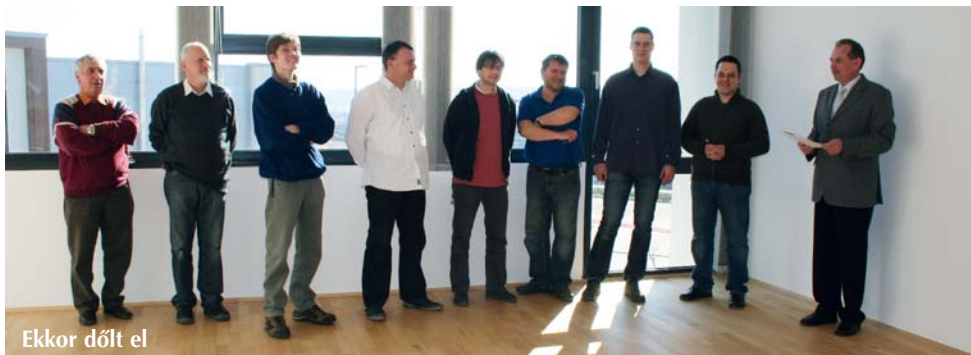
Ekkor dőlt el

A közös bejárás végén minden vezetőségi tag elmondta a véleményét, és a többségi döntés alapján, figyelembe véve mostani igényünket és az esetleges távlati fejlesztés lehetőségét is, egy kisebb, a rendezés alatt lévő szép völgyre néző, mutató iroda bérlése mellett döntöttünk.