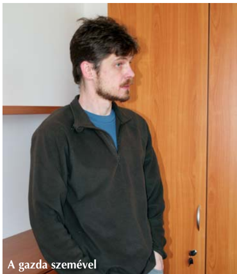
A gazda szemével

Munkába május első hetében áll, hivatalos bemutatkozására az első vezetőségi ülésen és az azt követő küldöttgyűlésen kerül sor. ■