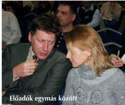
Előadók egymás között

ekkora érdeklődésre tart számot, milyen hálás feladat a legjobb előadókat megnyerni erre, és így már természetes, hogy a támogató szponzorok egymást előzve foglalják le a felkínált helyeket.